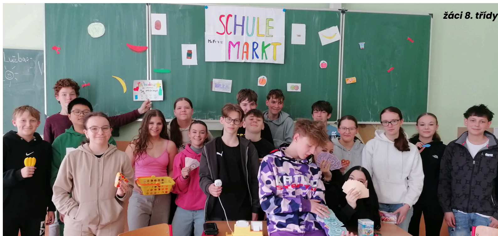
žáci 8. třídy

Jak se nám to líbilo, je patrné z fotografií a už se těšíme na to, až budeme zkoušet další situace, které nás v Německu mohou potkat např. objednávka jídla v restauraci a popis cesty v rámci cestování.