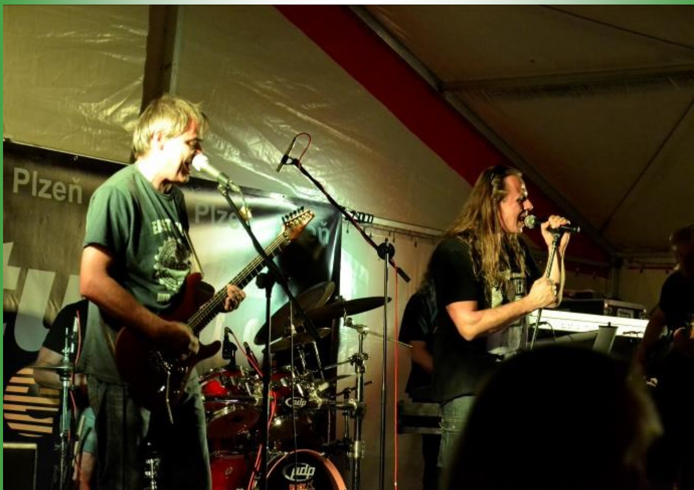
Pivní slavnosti 16. 7. 2016