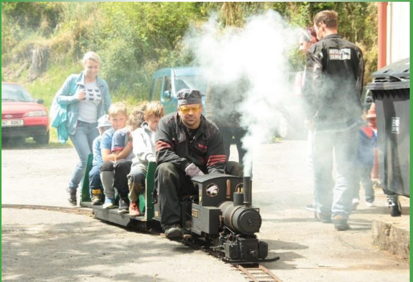
Bezdrůžické parní léto 16. 7. 2016