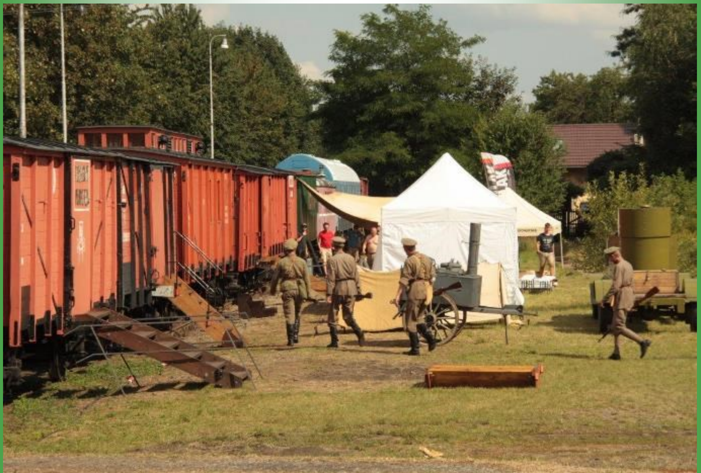
Vlastním pořádkem - legiovlak 23. 7. 2016