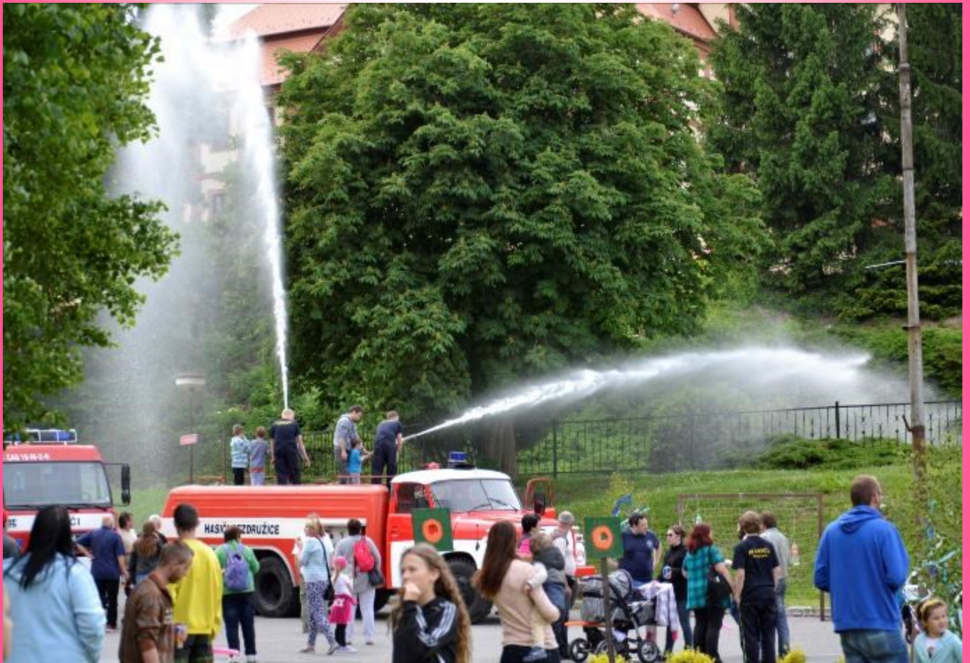
Dětský den 11. 6. 2016