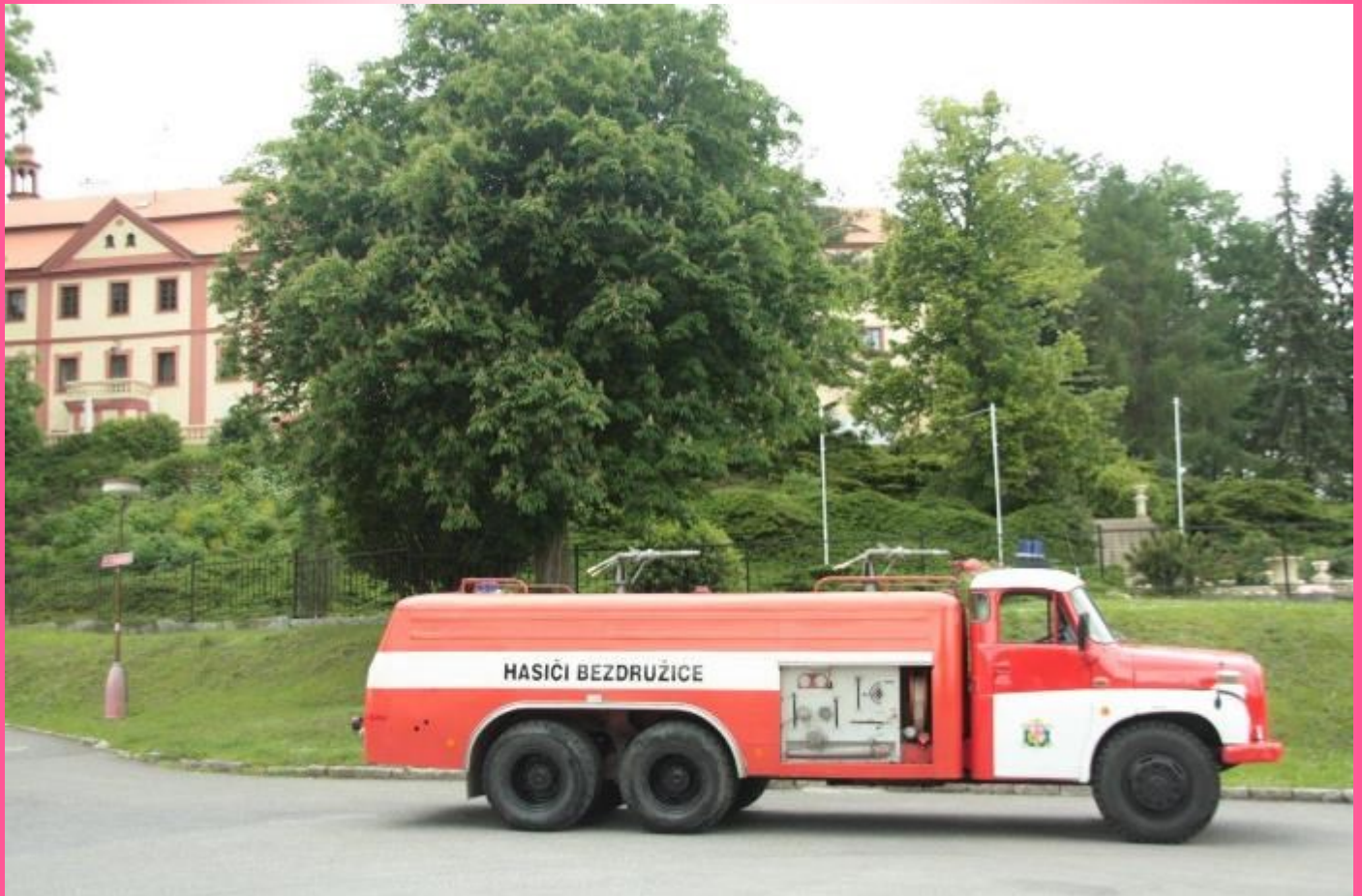
Ukázka nového hasičského vozu Tatra 148 - 4. 6. 2016