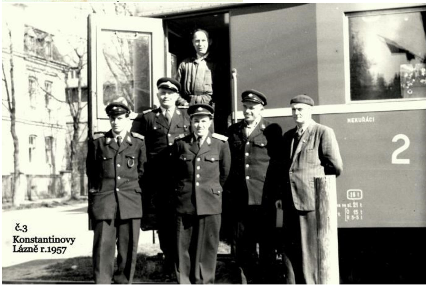
č.3 Konstantinovy Lázně r.1957