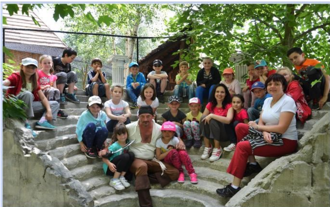
FANTASY GOLF PLASY 10.6.2016