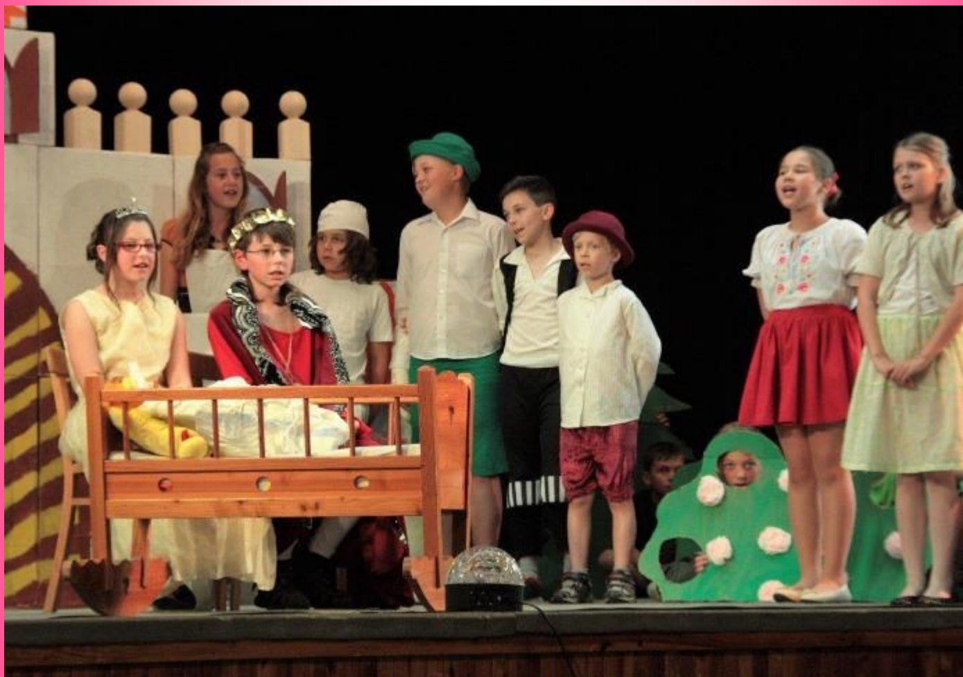
Muzikál Tři bratři 9. 6. 2016